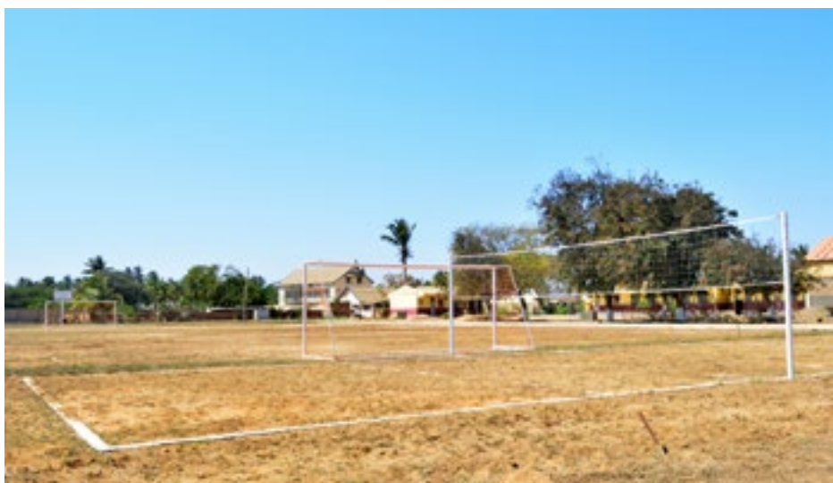
Le bâtiment sanitaire & le terrain de sport